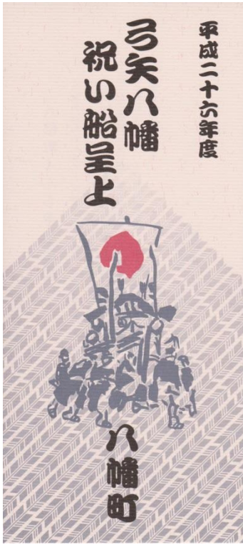
弓矢八幡祝い船呈上札